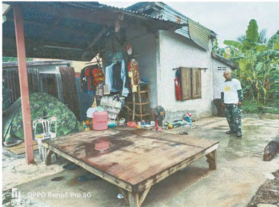
ภาพบ้านที่เหตุวาทภัยขึ้นเมื่อวันที่ ๑๘ เมษายน ๒๕๖๕ เวลาประมาณ ๑๙.๐๐ น.