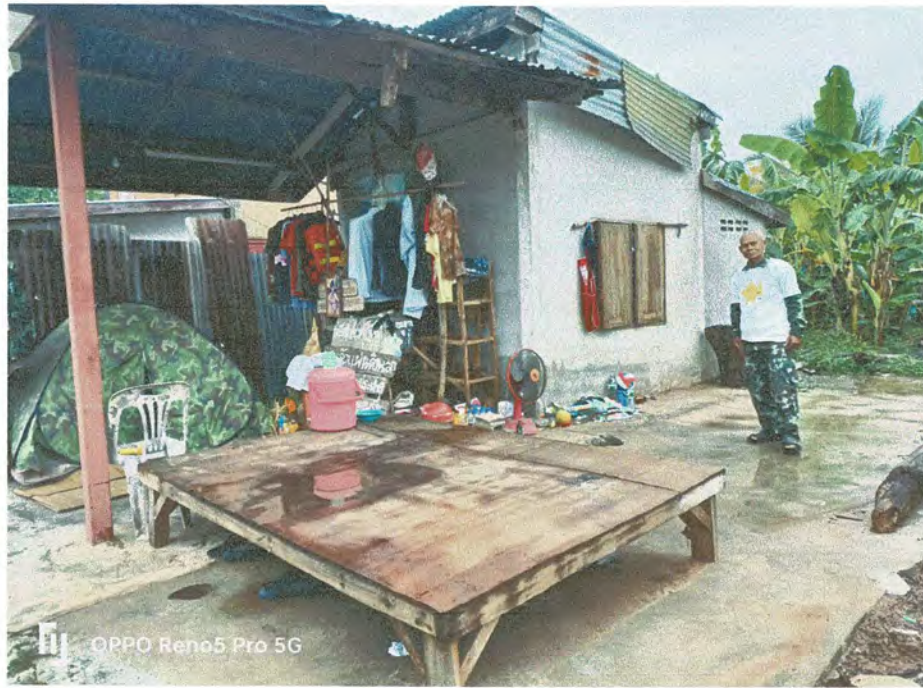
ภาพบ้านที่เหตุวาทภัยขึ้นเมื่อวันที่ ๑๘ เมษายน ๒๕๖๕ เวลาประมาณ ๑๙.๐๐ น.